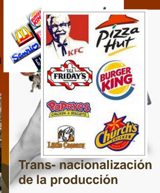
Trans- nacionalización de la producción