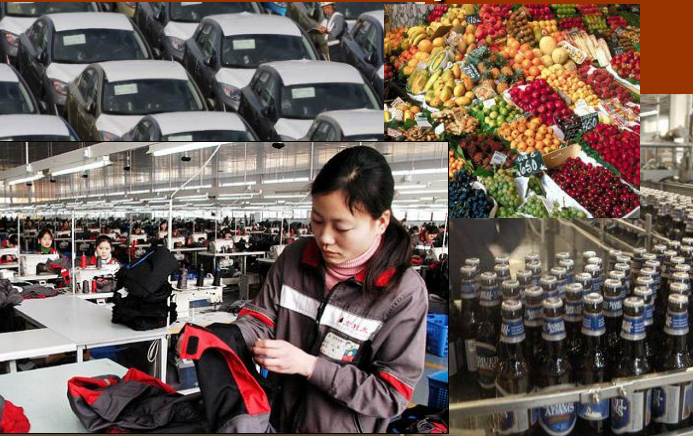
Crecimiento de la producción