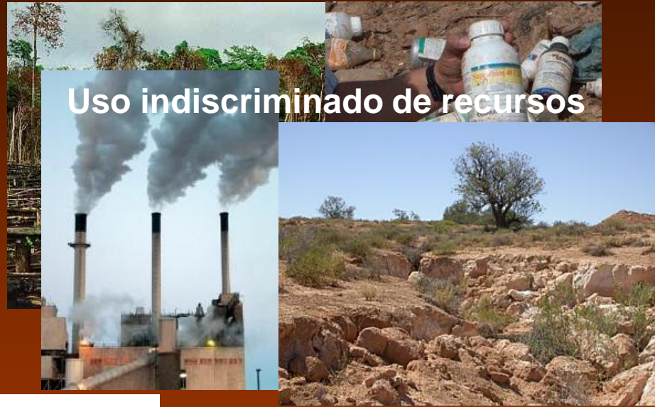
Uso indiscriminado de recursos